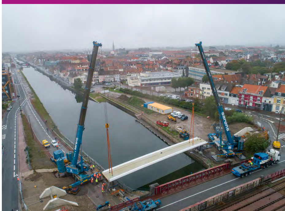
Pose du tronçon principal 12 octobre 2019