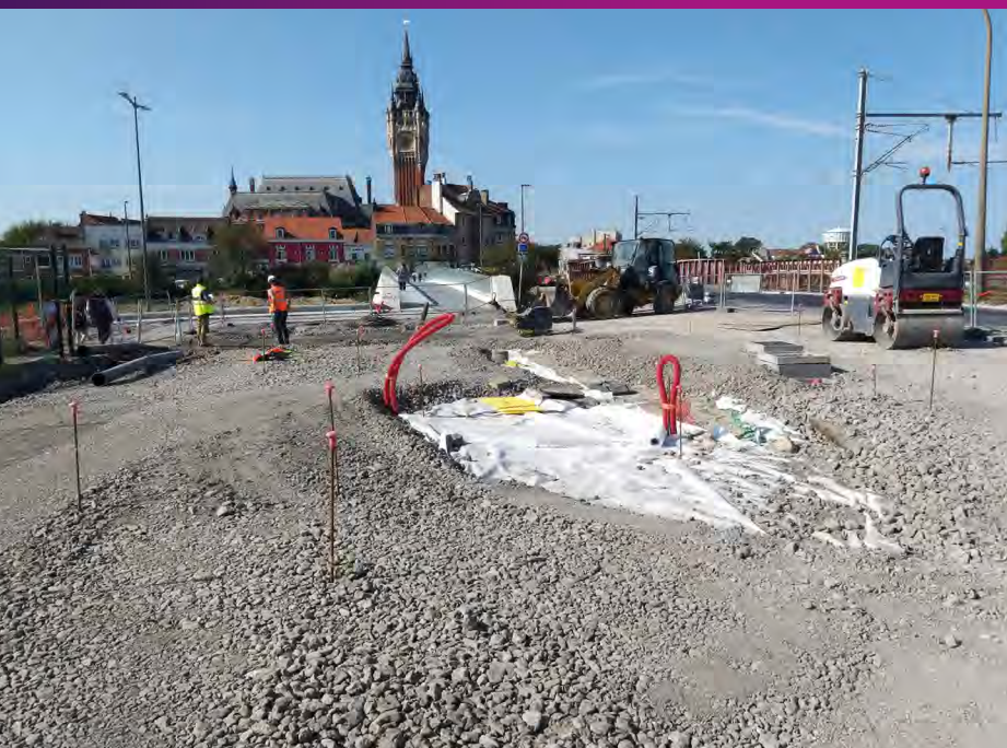
Création de la placette quai de la Gendarmerie Novembre 2020