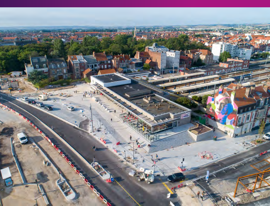
Vue aérienne des aménagements du parvis de la gare Août 2021