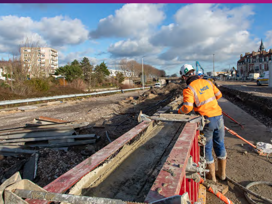
Construction d'un mur de soutènement en crête du talus pour la voie bus de la gare routière Décembre 2020