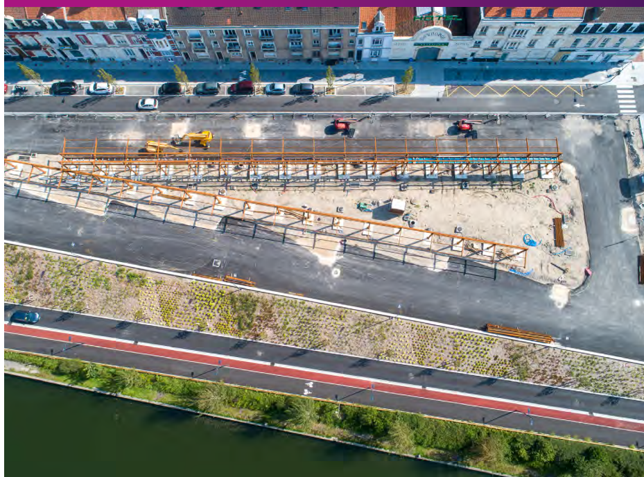
Implantation des structures en acier corten Août 2021