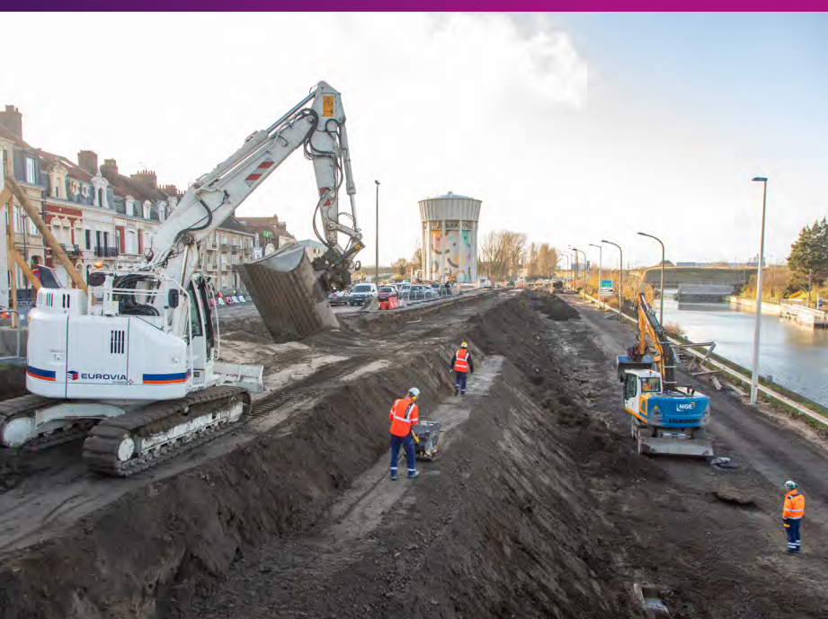
Vue aérienne des travaux engagés quai du Danube Décembre 2020