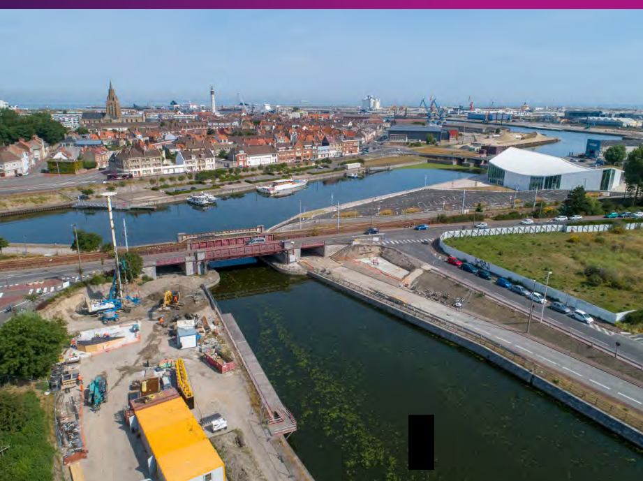
Chantier de la passerelle Mollien Juillet 2019