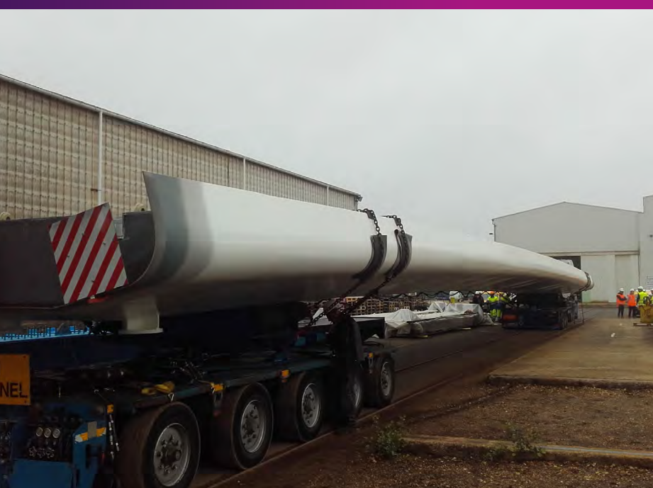
Départ du convoi exceptionnel transportant les travées 08 octobre 2019