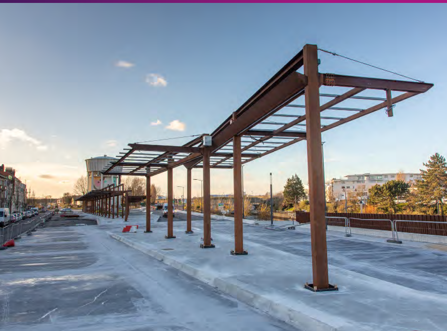
Création des quais et voies bus en béton Novembre 2021