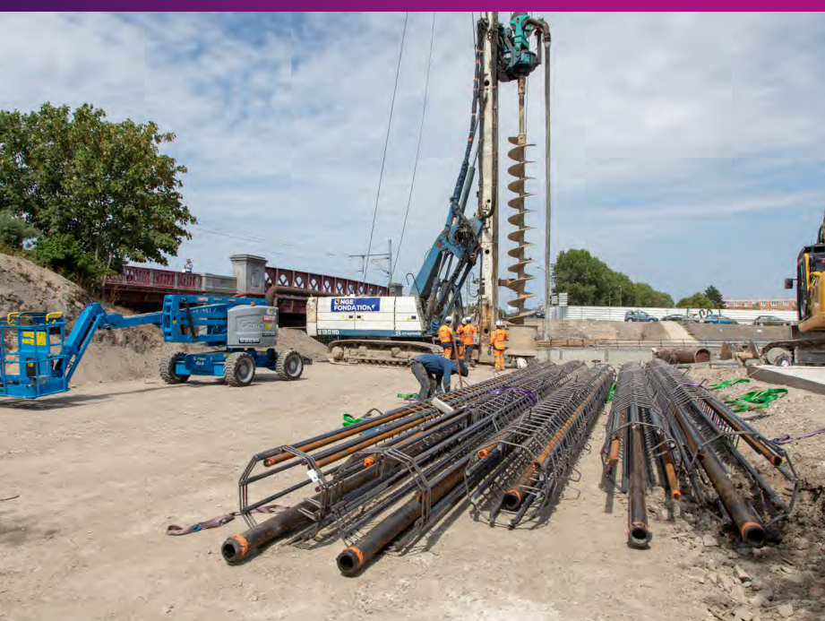
Implantation des pieux de soutènement Eté 2019