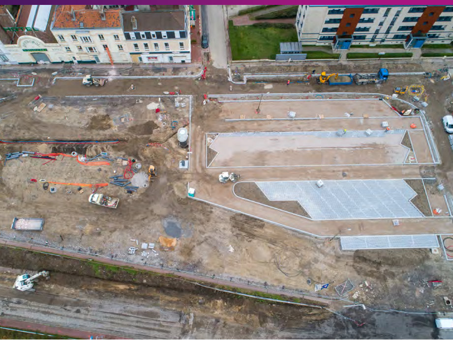
Vue aérienne des travaux engagés quai du Rhin Novembre 2020