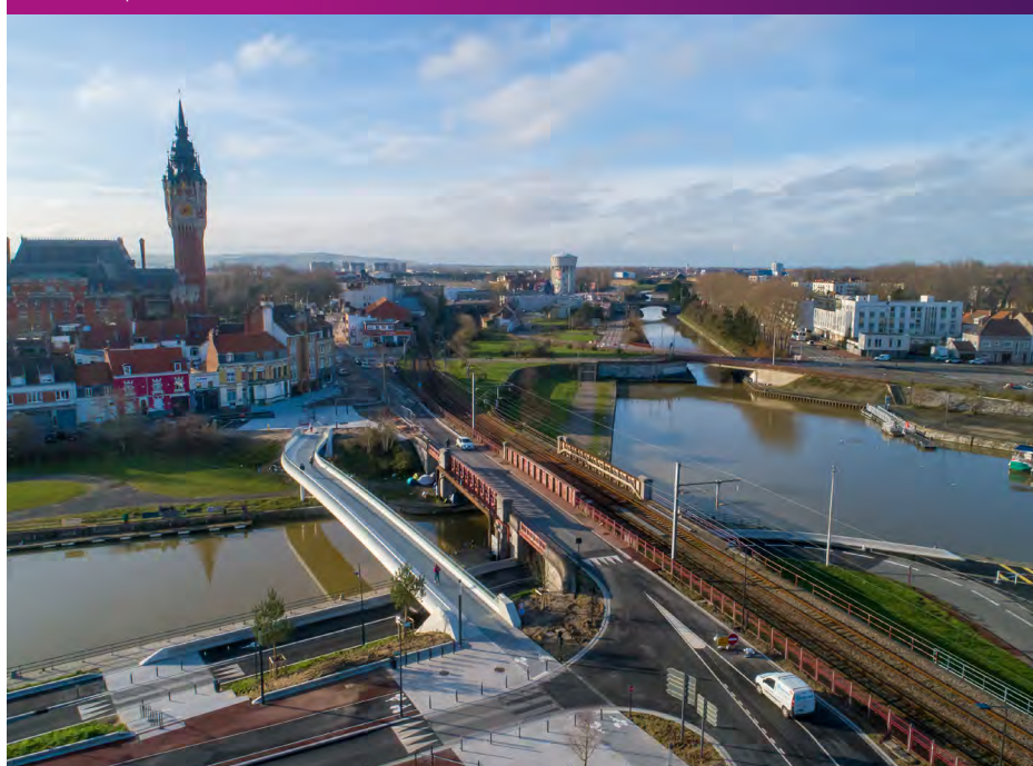
Chantier des abords de la passerelle Septembre 2020