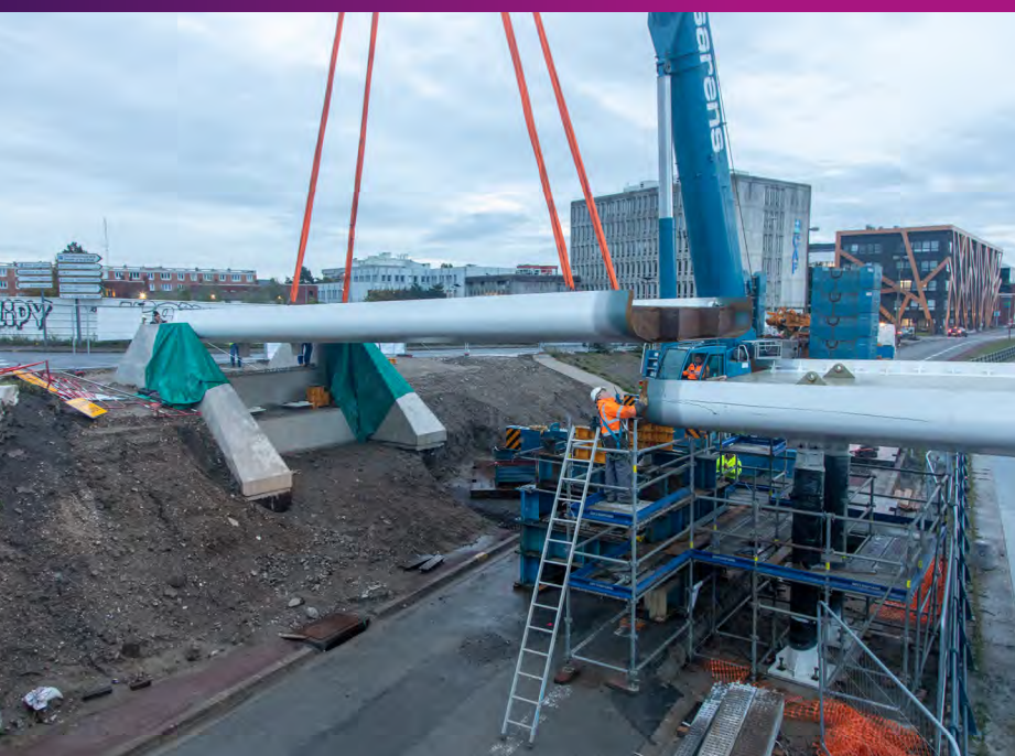
Pose du 2 ème tronçon 15 octobre 2019