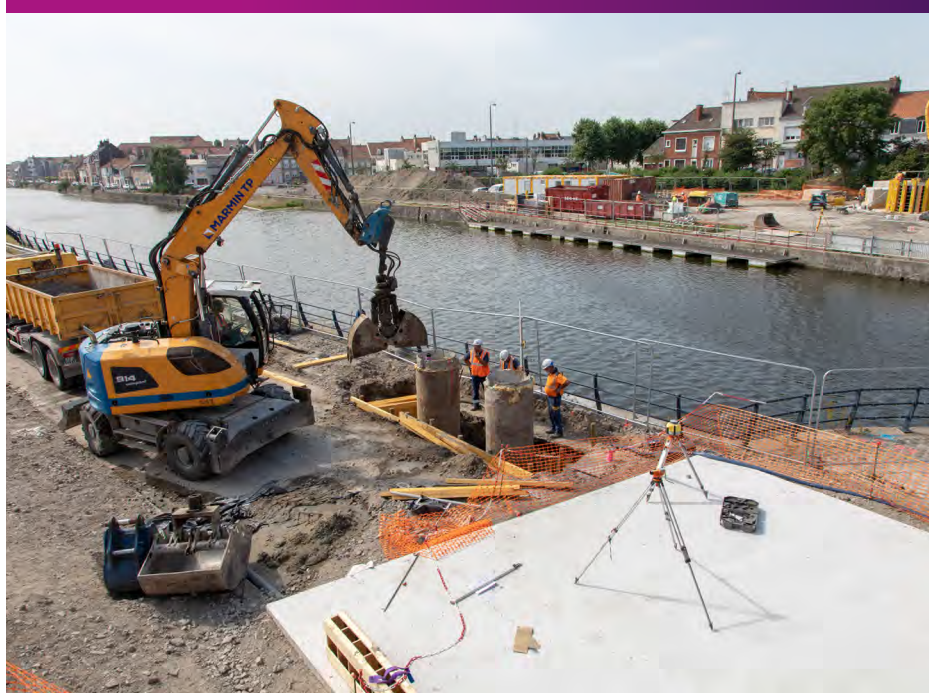
Implantation des structures de soutènement Eté 2019