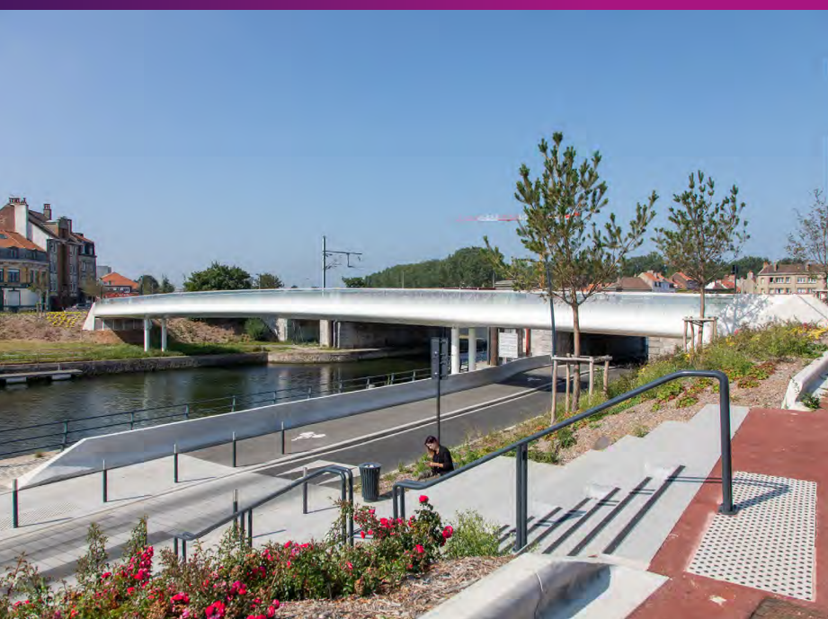
Escalier panoramique quai de la Gendarmerie