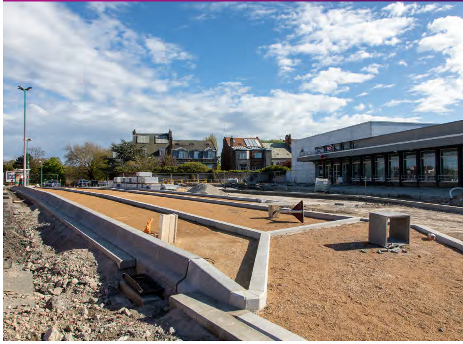
Création d'une voie réservée aux taxis et à la dépose-minute Mai 2021