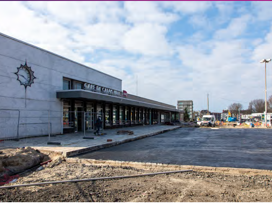
Vue du parvis de la gare Mars 2021