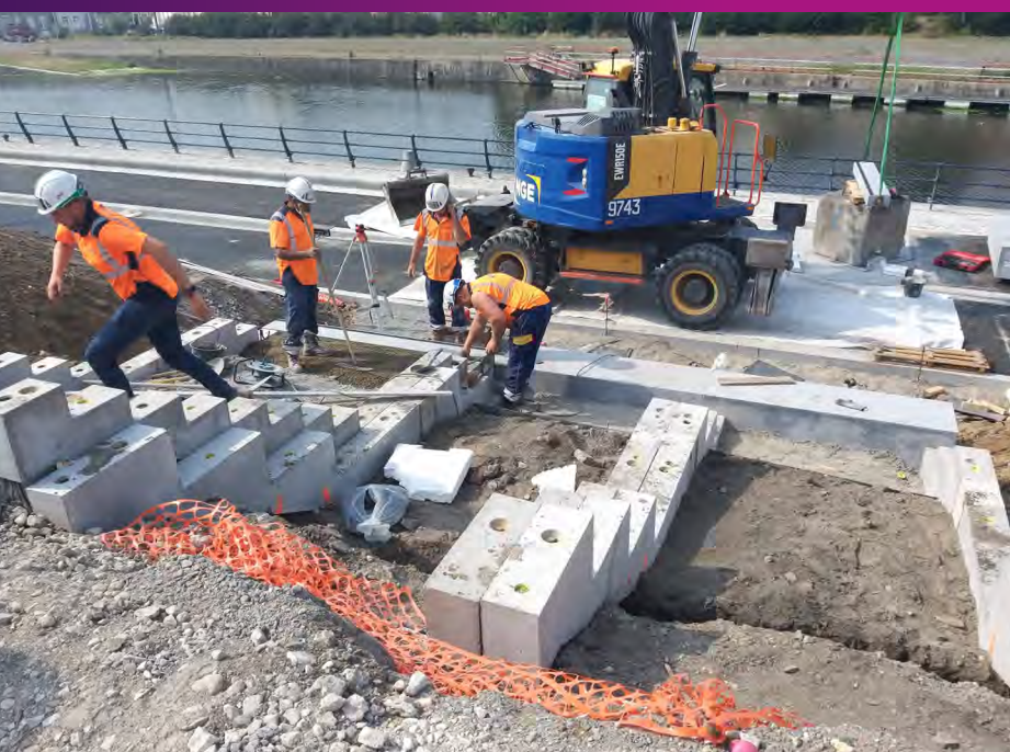
Construction de l'escalier panoramique quai de la Gendarmerie Novembre 2020