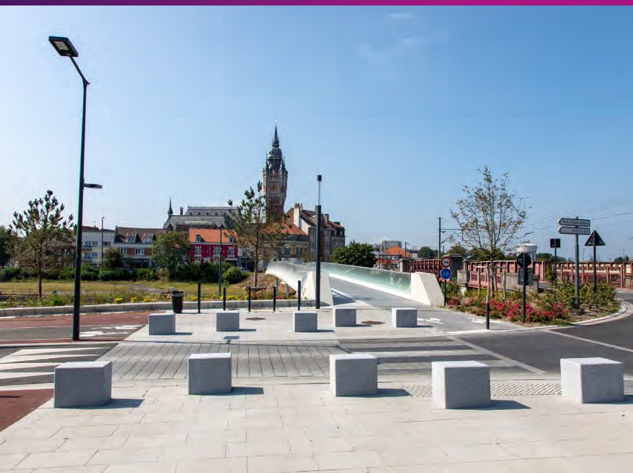
Nouvelle placette quai de la Gendarmerie