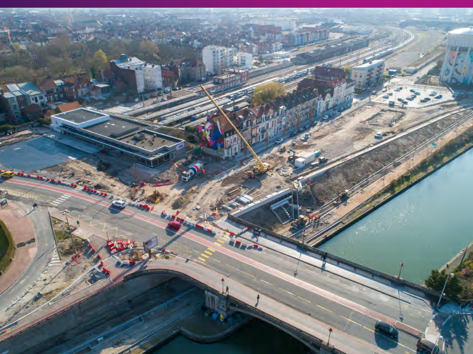
Chantier du Pôle d'Echanges Multimodal Mars 2021