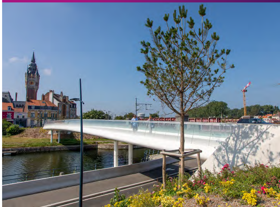
Requalification de la voie sur berge quai de la Gendarmerie