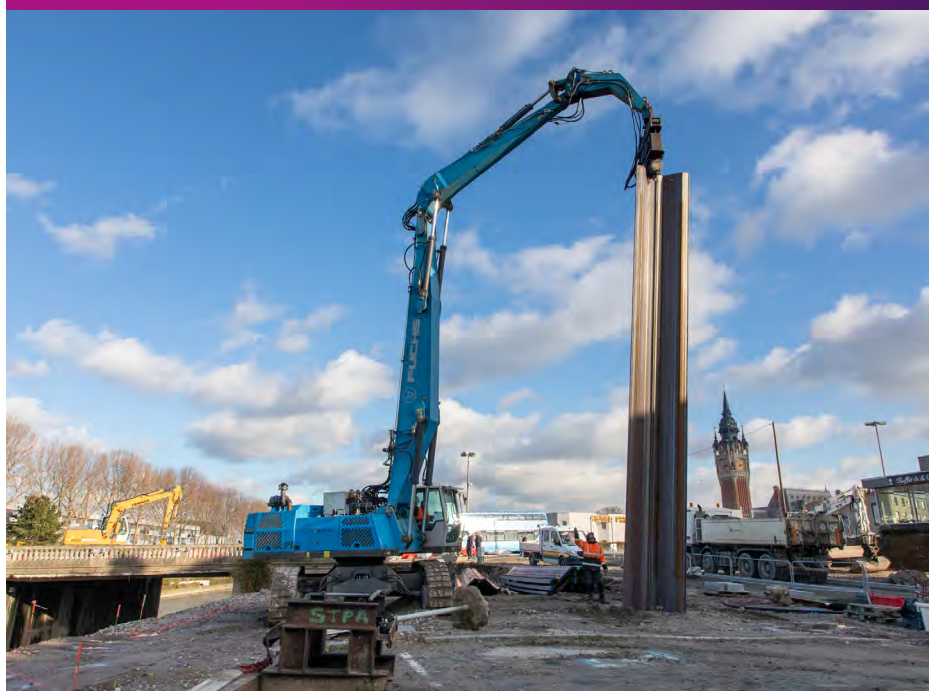
Implantation de palplanches pour renforcer le talus qui accueillera l'escalier gradin Décembre 2020