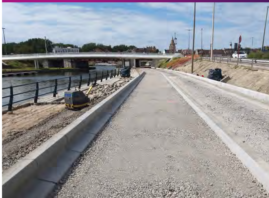
Requalification de la voie sur berge quai de la Gendarmerie Novembre 2020