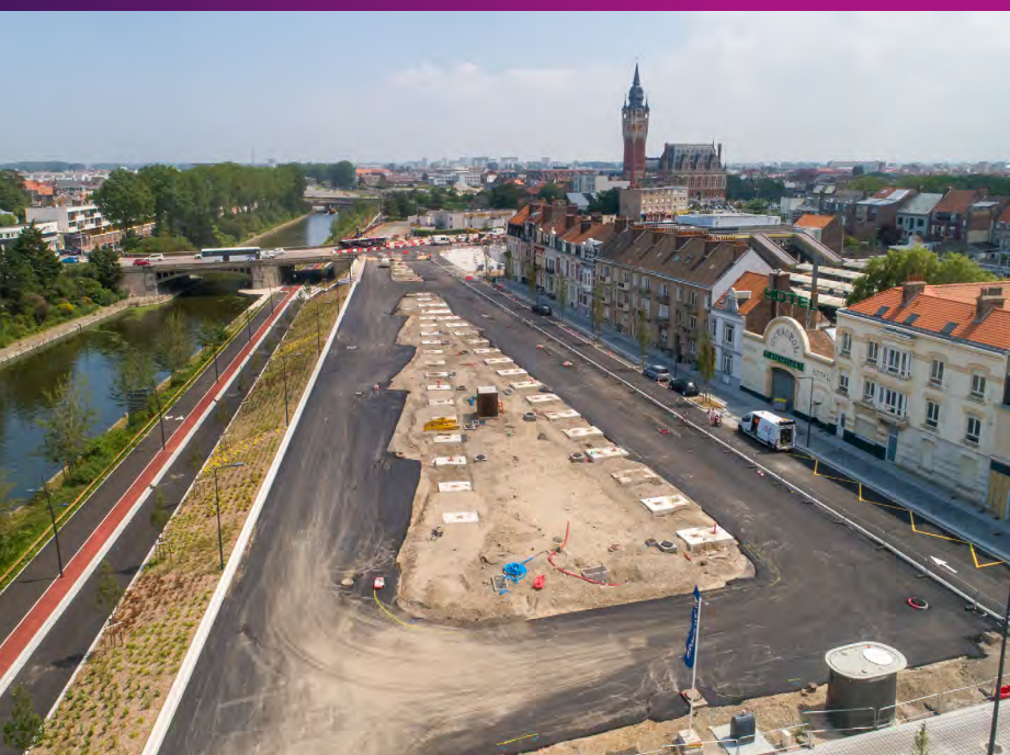
Vue aérienne des travaux engagés pour la nouvelle gare routière quai du Rhin Juillet 2021