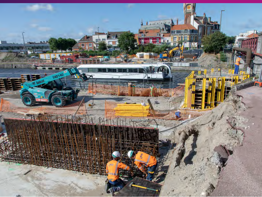
Construction des murs de soutien Eté 2019